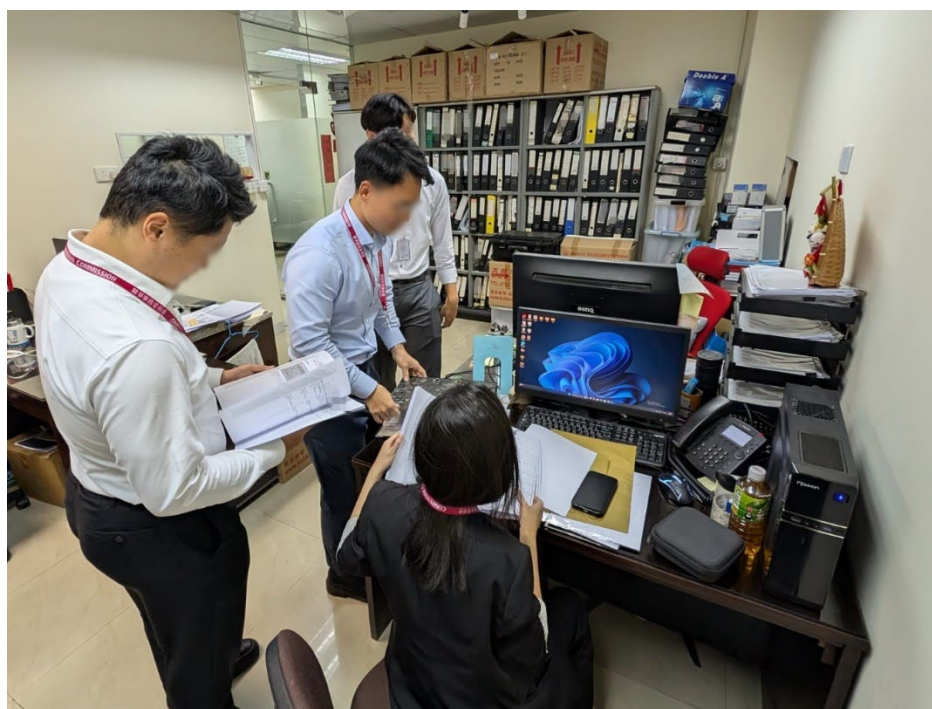
競爭事務委員會就樓宇維修圍標案件展開搜查行動