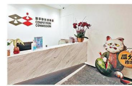
■ 競委會首次向促成合謀行為的企業追究法律責任。（資料圖片）

6間酒店集團及一間旅遊櫃檯營辦商，因促成兩間本身屬競爭對手的旅遊服務供應商合謀，統一在有關酒店內銷售景點門票及車票等價格，被競爭事務委員會發出違章通知書，企業需要承認違反《競爭條例》，同意終止違法行為，並承諾作出跟進糾正等措施。競委會認為，以承諾書代替法律程序，屬最恰當處理方法。