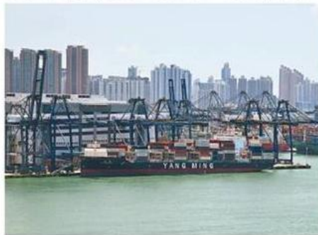
競爭事務委員會完成本港四大貨櫃碼頭公司合組「香港海港聯盟」調查。圖為葵青貨櫃碼頭。

因應競委會的調查，聯盟同意作出多項承諾，包括設定收費水平上限等，為期八年，競委會認為這些承諾有助釋除疑慮，將作公開諮詢至本月底，再考慮是否接受，之後或會中止調查。