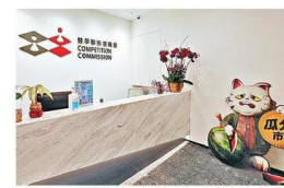
■ 競委會首次向促成合謀行為的企業追究法律責任。

6間酒店集團及一間旅遊櫃檯營辦商，因促成兩間本身屬競爭對手的旅遊服務供應商合謀，統一在有關酒店內銷售景點門票及車票等價格，被競爭事務委員會發出違章通知書，企業需要承認違反《競爭條例》，同意終止違法行為，並承諾作出跟進糾正等措施。競委會認為，以承諾書代替法律程序，屬最恰當處理方法。